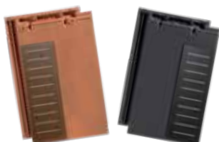
Ukončovací taška HP10 SOLAR