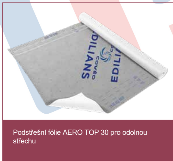
Podstřešní fólie AERO TOP 30 pro odolnou střechu